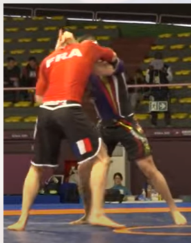
Rouge et bleu sont au contact

Dans ce cas, 2 points seront attribués à l'adversaire (comme s'il avait effectué une amenée au sol). Toutefois, même si le tirage de garde est pénalisé de 2 points en faveur de l'adversaire, il doit s'effectuer à partir d'une saisie de l'adversaire. S'asseoir sans contact préalable avec l'adversaire sera sanctionné d'une pénalité, 1 point attribué à l'adversaire, d'un arrêt du combat pour une reprise au centre debout.