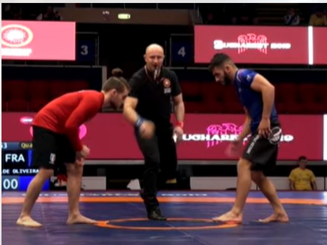
Coup de sifflet de l'arbitre

Dans le cas où, dans les 3 secondes à partir du coup de sifflet de l'arbitre (pour lancer ou redémarrer le combat depuis la position debout ), une amenée au sol est initiée par l'un des athlètes et une position supérieure est assurée sans aucune interruption de l'action et du contact entre les deux compétiteurs, l'arbitre attribuera, séparément, 2 points supplémentaires à l'athlète capable d'assurer le contrôle de la position supérieure pendant au moins 3 secondes.