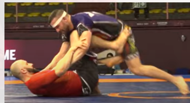
La position est stabilisée au moins 3 secondes, bleu est en position supérieure donc il gagne 2 points.

Attention : Comme pour l'amenée au sol rapide (fast takedown), si le combattant effectue un tirage de garde dans les 3 secondes qui suivent le coup de sifflet de l'arbitre lors d'un départ debout (début du combat ou redémarrage suite à une sortie de l'aire par exemple), son adversaire gagnera 2 points d'amenée au sol + 2 points de bonus (fast takedown).