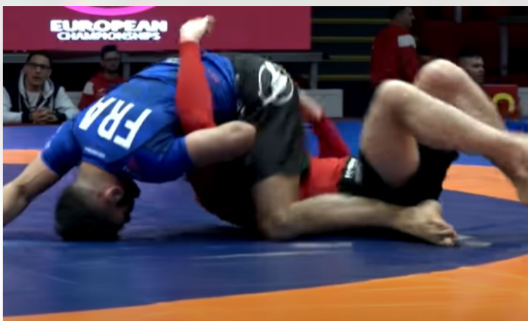
Le combattant bleu poursuit son action sans interruption et jusqu'au bout. Il contrôle la position supérieure pendant au moins 3 secondes.