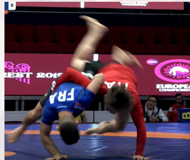
Le combattant bleu amorce une amenée au sol dans les 3 secondes qui suivent le coup de sifflet de l'arbitre