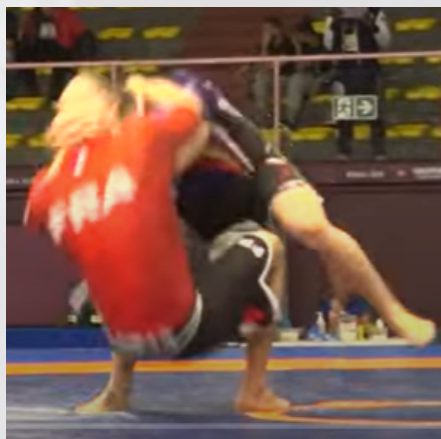
Rouge vient s'asseoir toujours au contact de bleu